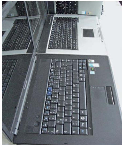
Abb. 7: Notebooks nach dem Aufarbeitungsprozess

Als Vermarktungskanäle kommen sowohl Ladengeschäfte (ggf. durch Partnerschaften) als auch Onlineportale, eine Kombination dieser Angebote in Frage. Aktuell (Stand Ende 2016) werden die Notebooks vorwiegend direkt vermarktet. Eine Weiterentwicklung der Angebote ist geplant. Außerdem werden Notebooks sozialen Einrichtungen für Bildungszwecke zur Verfügung gestellt. Entscheidende Bedeutung im Hinblick auf die Wiedervermarktung kommt der Kommunikation und Dokumentation der definierten Aufarbeitungsqualität der Geräte zu.