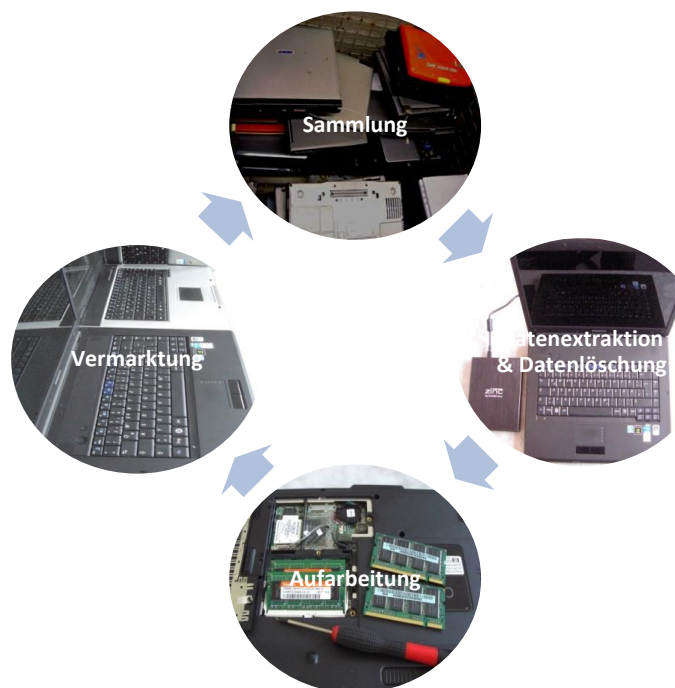
Abb. 3: Projekttablauf

Das Projekt gliedert sich in 4 Kernprozesse, die im Folgenden erläutert werden: