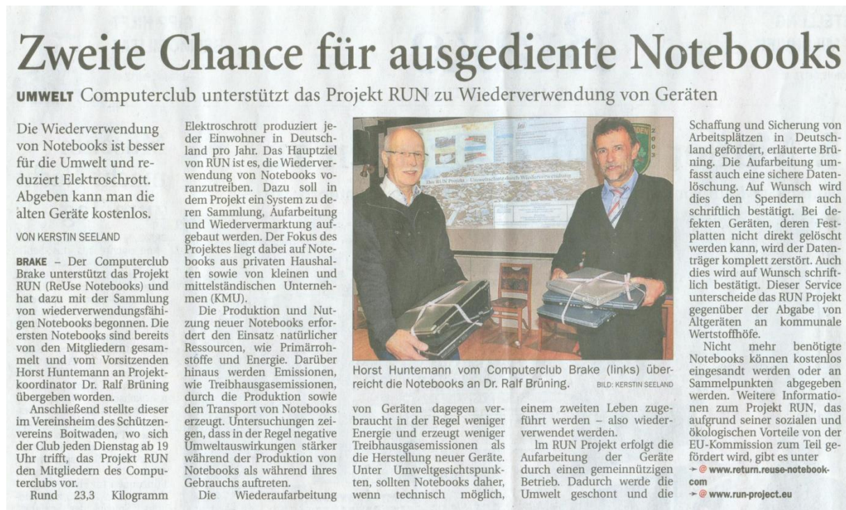
Abb. 4: Sammlung von Notebooks

Darüber hinaus führt RUN gerne Sammelaktionen mit lokalen Partner (z.B. Vereine) durch (s. Abb.4). Lokale Organisationen unterstützen so die Umwelt und profitieren vom Medienecho. Interessierte Partner können sich gerne an das RUN Team wenden um weitere Informationen zu erhalten.