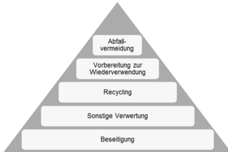
Abb. 2: Abfallhierarchie gemäß Abfallrahmenrichtlinie

Die obersten Ziele der europäischen Abfallpolitik 3 sind die Abfallvermeidung und die Vorbereitung zur Wiederverwendung (s. Abb. 3.).