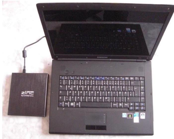
Abb. 5: Datenextraktion